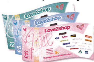
Talebau siopau'r stryd fawr Love2Shop

Os bydd eich plentyn yn cymryd rhan mewn unrhyw gam yn astudiaeth Well mi, byddwn yn diolch iddo ef/hi trwy roi taleb gwerth £15. Bydd eich plentyn yn gallu dewis bob tro rhwng naill ai talebau siopau'r stryd fawr, neu daleb iTunes©.