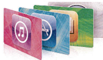
talebau iTunes ©

Beth fydd yn digwydd i'r wybodaeth fydd fy mhlentyn yn ei rhoi?